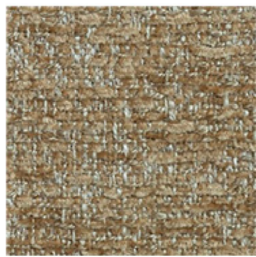
clusone - 05