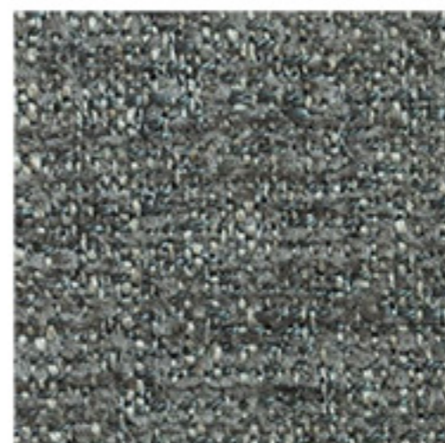
clusone - 12