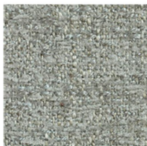
clusone - 19