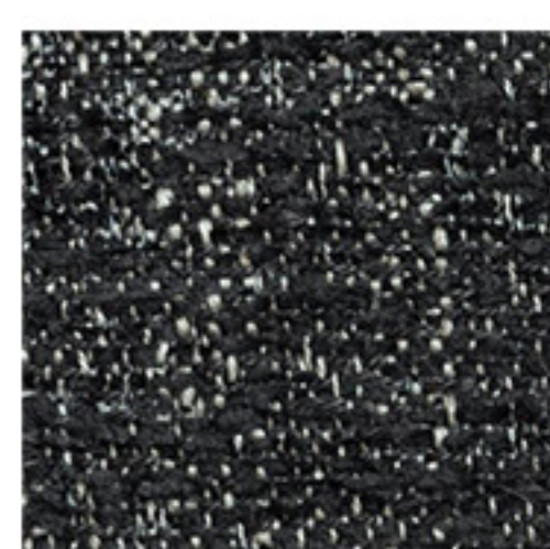
clusone - 13