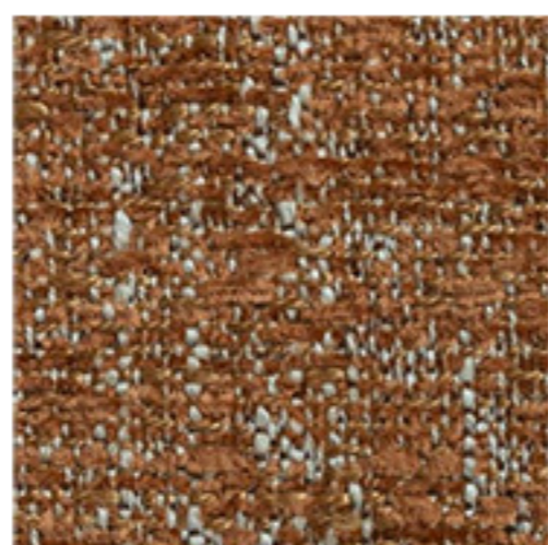
clusone - 10