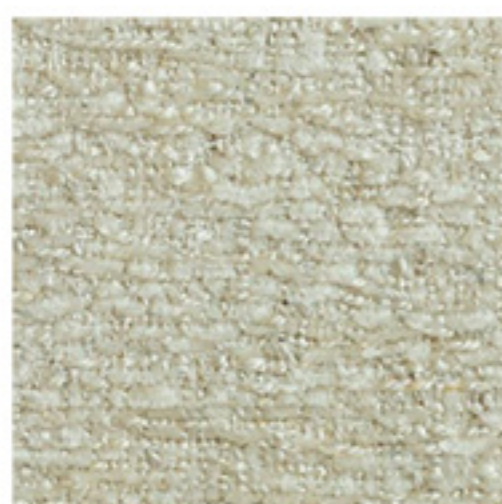
clusone - 04

Composizione 32% viscosa - 13% cotone - 15% lino - 25% acrilico - 15% poliestere