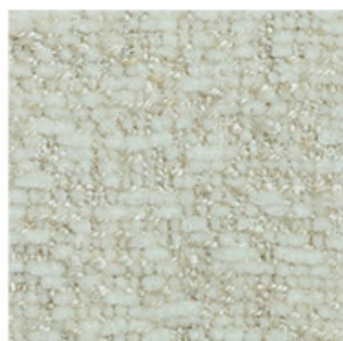
clusone - 08