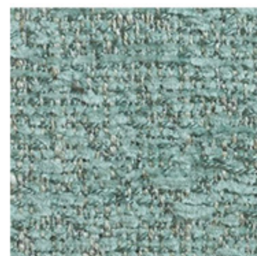
clusone - 24