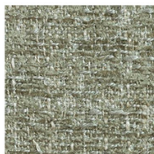
clusone - 06