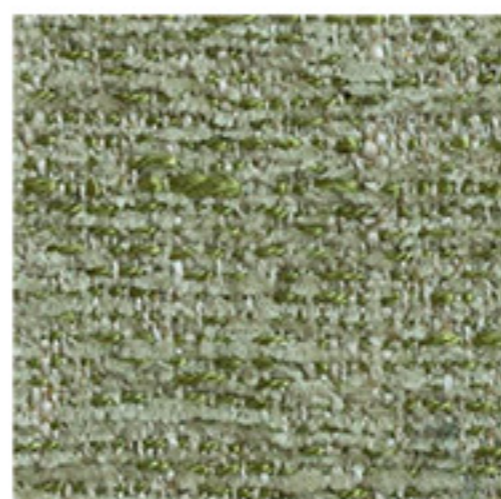
clusone - 22